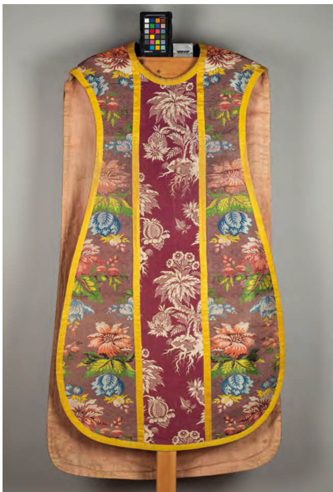
Lám. 2. Casulla morada. Brocado. ¿Talavera la Real-Lyon? Siglo XVIII. (Inv. 363)

manípulos, cíngulos, paños para el cáliz y purificadores.