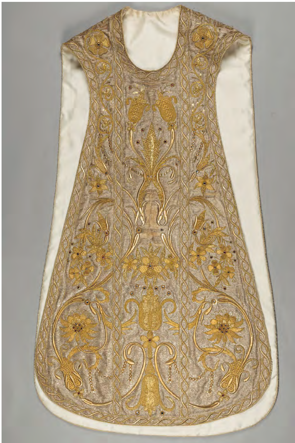
Lám. 11. Casulla. Tisú de plata, hilos de oro. Siglo XIX. (Inv. 70)