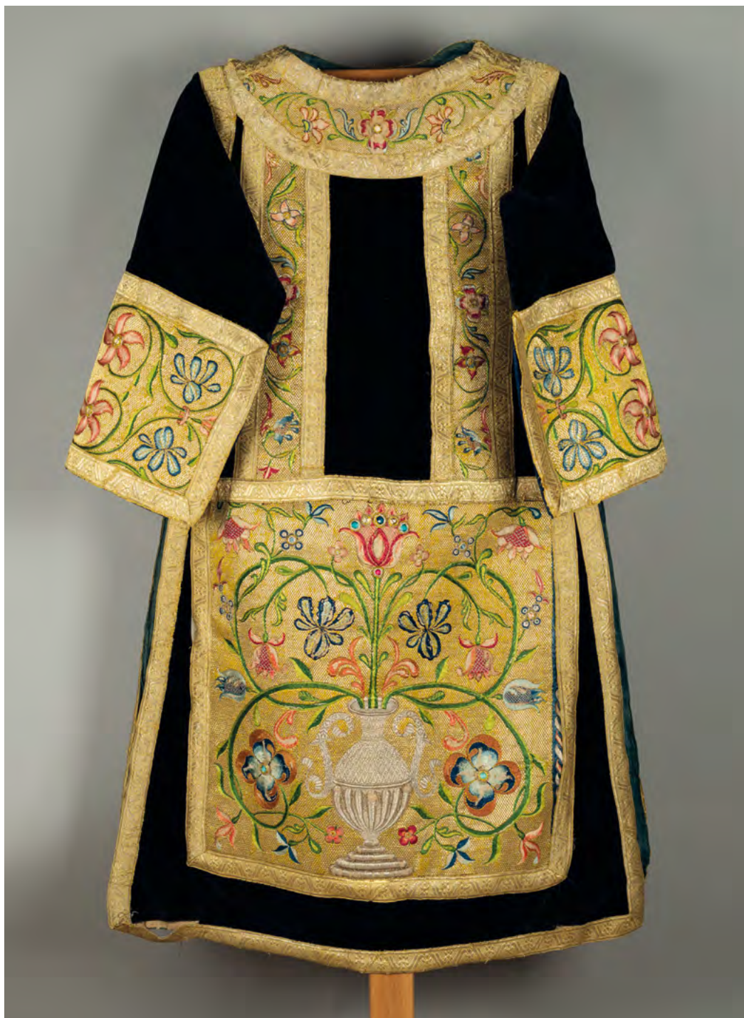
Lám. 7. Dalmática negra. Terciopelo, hilos de oro y sedas de colores. Siglo XVII. (Inv. 375)