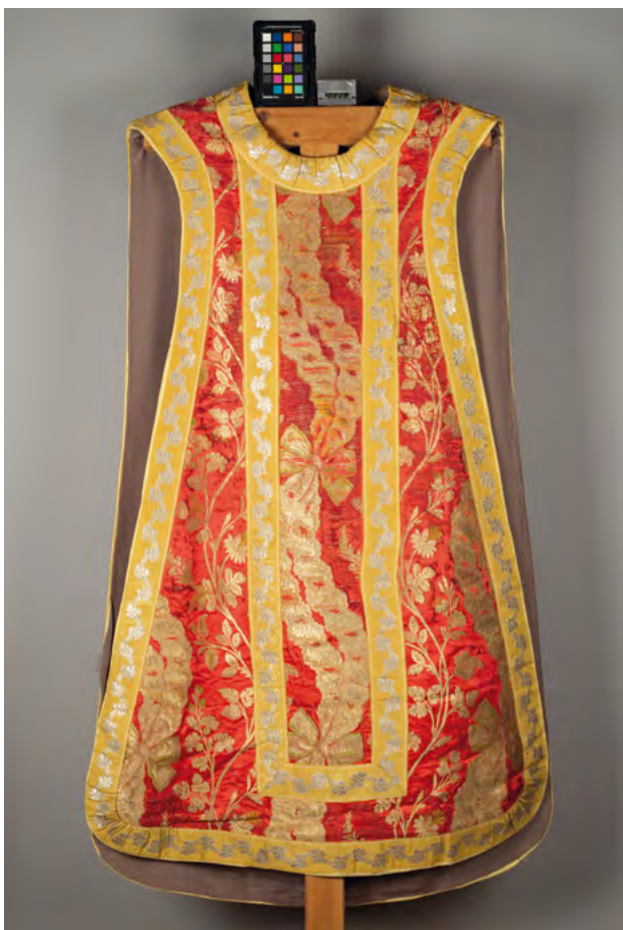
Lám. 6. Casulla roja. Brocado. Valencia. Hacia 1800. (Inv. 361)