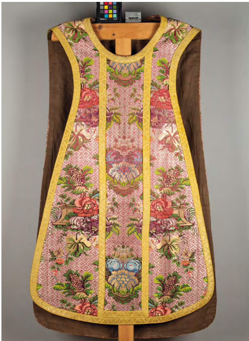
Lám. 3. Casulla morada. Brocado. ¿Talavera la Real-Lyon? Siglo XVIII. (Inv. 367)