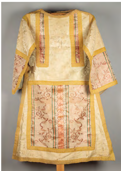
Lám. 4. Dalmática rosa. Brocado. Lyon. Último tercio siglo XVIII. (Inv. 374)