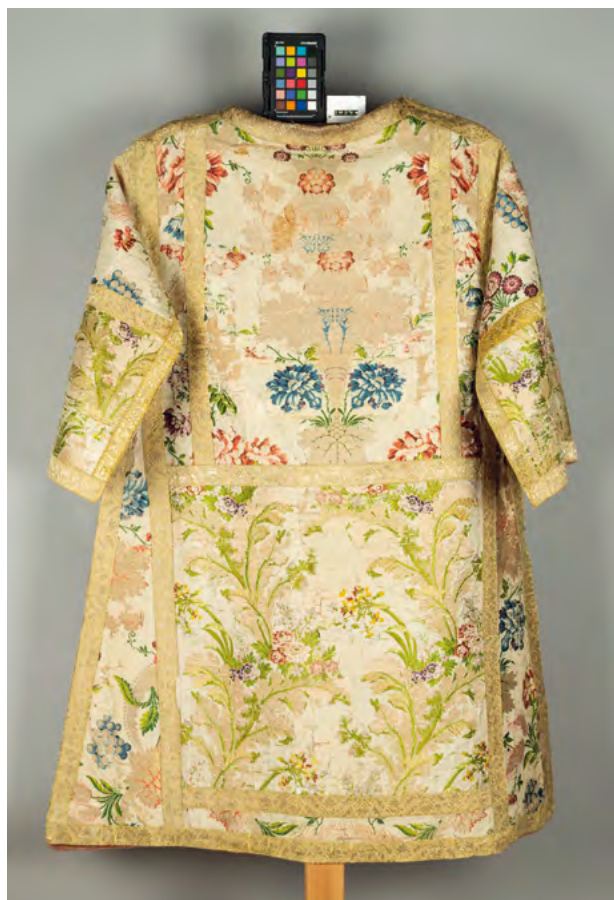
Lám. 1. Dalmática blanca. Brocado. Lyon. Segunda mitad siglo XVIII. (Inv. 384)

Por tanto el inventario de las mismas supone una herramienta fundamental para su conservación y su puesta en valor. Como apunta Elías Francisco Zaít León: “Los inventarios en general y los parroquiales en particular son una fuente de gran riqueza para el estudio de la Historia, el arte y otras disciplinas académicas. Tienen la utilidad de cuantificar todos los bienes en propiedad o