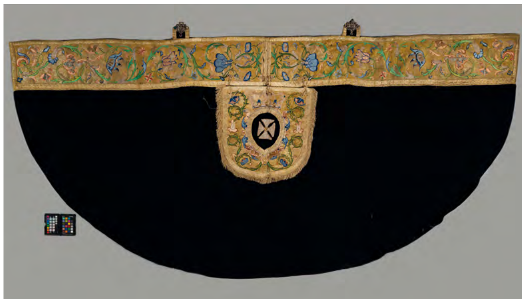
Lám. 8. Capa pluvial negra. Terciopelo, hilos de oro y sedas de colores. Finales siglo XVIII. (Inv. 353)

vecino. Por todo ello las telas confeccionadas en ella disfrutaron de una gran reputación y fueron las predilectas para realizar tanto las vestimentas civiles como los ornamentos litúrgicos. 9 Como señala Ana Agreda Pino en esta época, por la similitud entre los textiles franceses y los españoles, es muy complicado distinguir el origen de los mismos. 10 De una parte está la denominada casulla verde (inv. 368) (Lám. 5), realizada específicamente en lampas espolinado, de hacia 1770. El interesante adorno reproduce los representativos encintados de amplias curvas-contracurvas que van enlazando de manera armoniosa aderezos y guirnaldas con flores de distintos colores. Y por otro la casulla roja (inv. 361) de finales de siglo (Lám. 6). Esta última, de tejido labrado de seda y plata, queda articulada por serpenteantes, gruesas y onduladas cintas adornadas con lazos junto a movidos tallos de los que emergen elementos vegetales y florales.