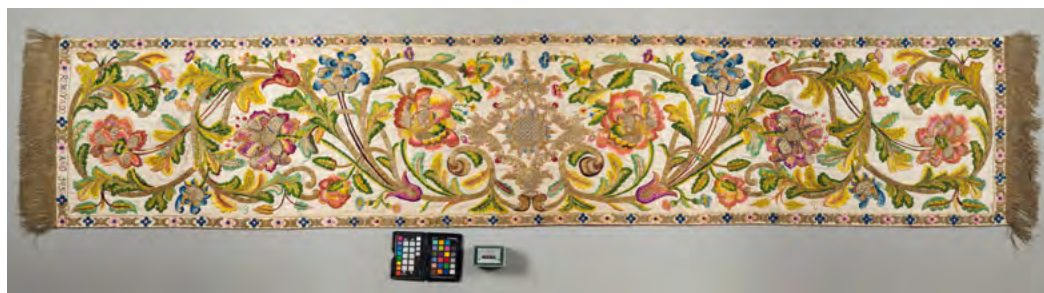
Lám. 10. Paño Humeral. Tejido de seda, hilos de oro, plata y sedas de colores. Siglo XVIII? (Inv. 460)

inscrita en un espacio casi circular que se remata con una corona. Asimismo queda rodeado por idéntico ornato. Muy interesantes son sus argénteos gafetes o broches que corroboran la datación de esta.