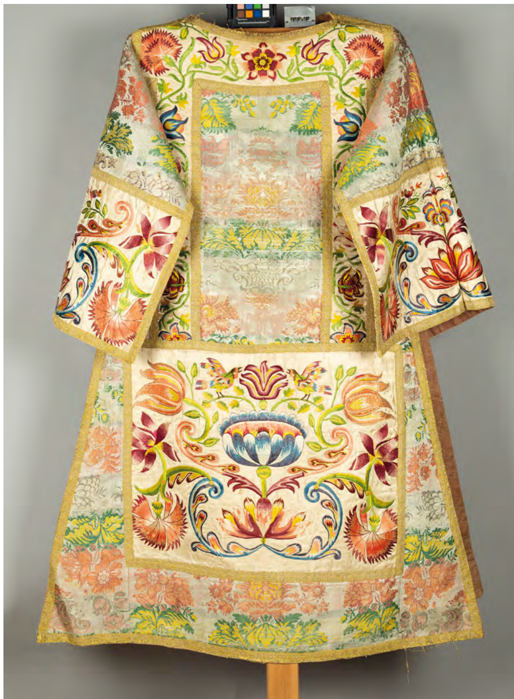
Lám. 9. Dalmática blanca. Brocado levantino, hilos de sedas de colores. Siglo XIX? (Inv. 383)