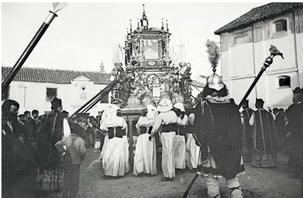
Procesión Santo Entierro, principios s. XX Autor Juan N. Díaz Custodio (Cesión y edición Julio Cerdá Pugnaire).