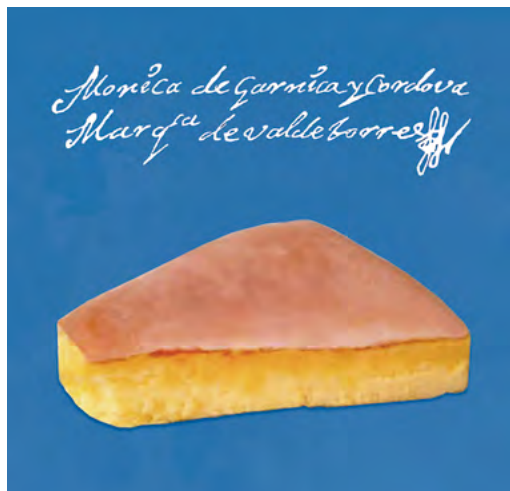
Lám. 1. Bizcocho Marroquí y firma de la marquesa de Valdetorres

En 1731 Bernardino Garnica y Córdoba se convierte en titular del marquesado de Valdetorres, condición que mantendrá hasta su fallecimiento en 1737. Mónica, como hija única, será llamada entonces a sucederle en los títulos y bienes vinculados del marquesado.