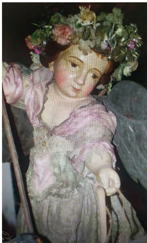
Ángel guiando a los bueyes perteneciente a la escultura de san Isidro, en paradero desconocido.

Una vez concluido se pretende que todos los hermanos que lo deseen tengan