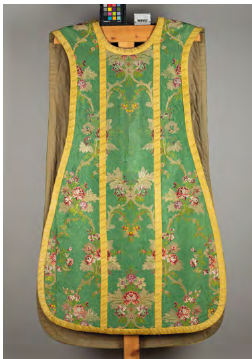
Lám. 5. Casulla verde. Brocado. Valencia. Siglo XVIII. (Inv. 368)

Por tanto, merced a dicho cometido impulsado por Julio Ojeda, se nos está permitiendo conocer y catalogar todas las piezas textiles que la parroquia posee en la actualidad. Aunque no es nuestro cometido aquí presentar todo el conjunto de ornamentos litúrgicos que posee la iglesia de San Juan, vamos a analizar desde un punto de vista formal y artístico algunas de las prendas más interesantes, con el fin último de poner en valor la riqueza de estos acervos que posee el templo.